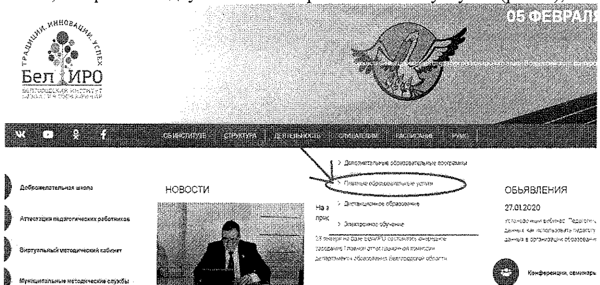
Рис. 2. Раздел «Платные образовательные услуги»

3) выбрать вкладку «Платные образовательные услуги» (рис. 2);