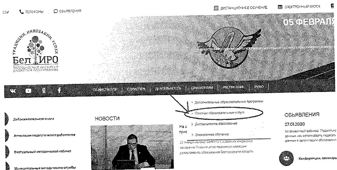
Рис.2 Раздел «Платные образовательные услуги»